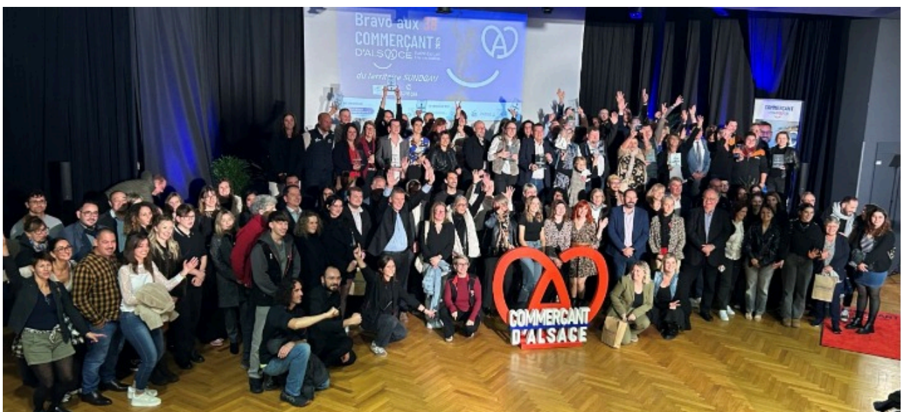
38 commerçants ont été labellisés lors de la soirée donnée en leur honneur le 4 novembre à la Halle aux blés d'Altkirch

Cette année, le résultat est à nouveau très concluant pour nos commerces ! Du Label "Argent" au prestigieux label "Platine", 38 enseignes sundgauviennes, dont 7 enseignes de la Communauté de communes ont prouvé que la qualité commerciale et l'excellence de leur savoir-faire.