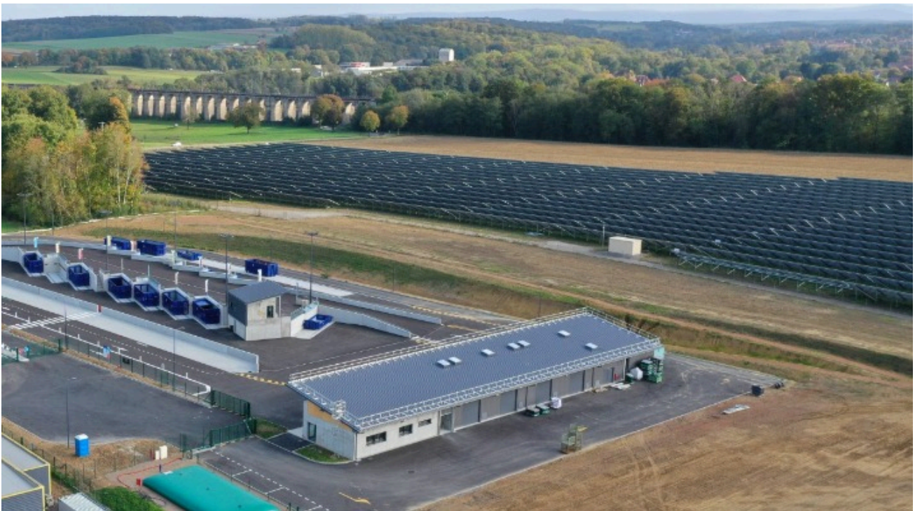
192 panneaux solaires sont installés sur le toit du bâtiment principal du centre de tri intercommunal

La Communauté de communes franchit une nouvelle étape dans sa transition énergétique avec la mise en œuvre d'un programme ambitieux qui permettra de produire et consommer localement l'énergie produite par nos installations d'énergie renouvelable.