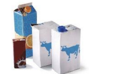
Briques et cartonnettes alimentaires