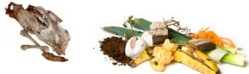
Restes de repas, viandes, poissons, fruits et légumes