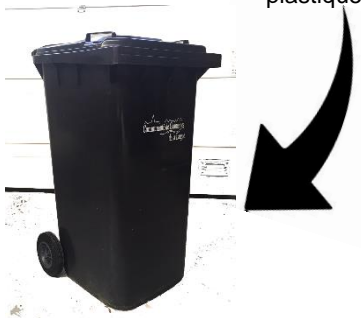
Petits objets en plastique