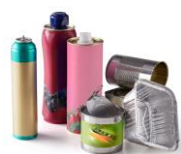
Emballages en métal et en aluminium