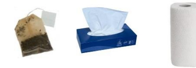
Sachets de thé, marc de café, mouchoirs et essuis tout...

Les sacs en plastique sont strictement interdits