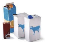
Briques et cartonnettes alimentaires