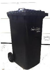
Petits objets en plastique