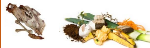
Restes de repas, viandes, poissons, fruits et légumes