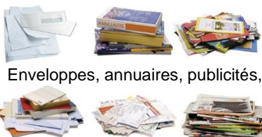
Enveloppes, annuaires, publicités,