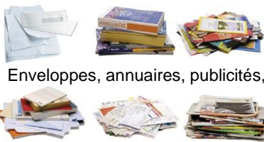
Enveloppes, annuaires, publicités,