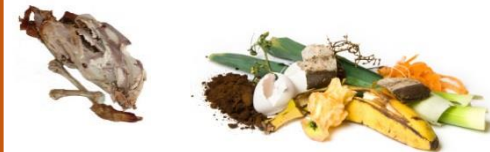
Restes de repas, viandes, poissons, fruits et légumes