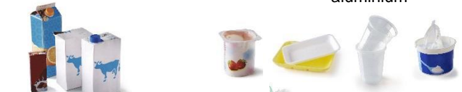
Briques et cartonnettes alimentaires