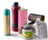
Emballages en métal et en aluminium