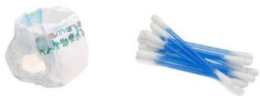
Couches et autres éléments hygiéniques