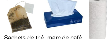
Sachets de thé, marc de café, mouchoirs et essuis tout...