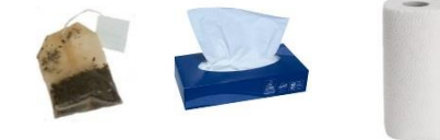
Sachets de thé, marc de café, mouchoirs et essuis tout...