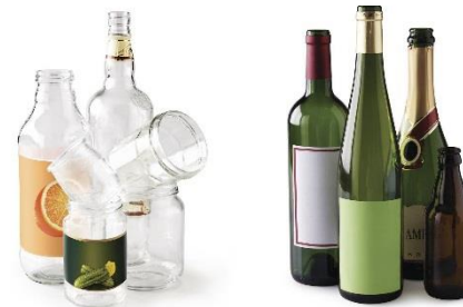
Bouteilles et bocaux en verre uniquement