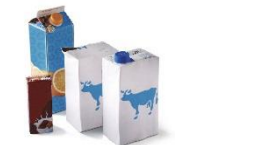
Briques et cartonnettes alimentaires