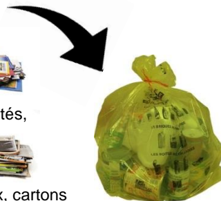
Cahiers, magazines, journaux, cartons