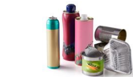
Emballages en métal et en aluminium