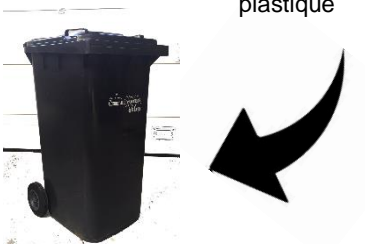
Petits objets en plastique