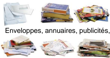
Enveloppes, annuaires, publicités,