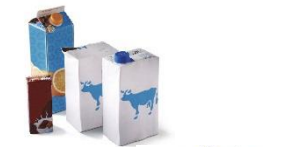
Briques et cartonnettes alimentaires