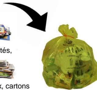
Cahiers, magazines, journaux, cartons