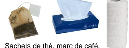
Sachets de thé, marc de café, mouchoirs et essuis tout...

Les sacs en plastique sont strictement interdits