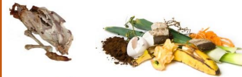
Restes de repas, viandes, poissons, fruits et légumes