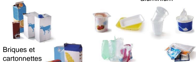
Briques et cartonnettes alimentaires