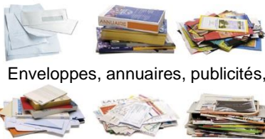
Enveloppes, annuaires, publicités,