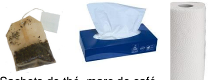
Sachets de thé, marc de café, mouchoirs et essuis tout...

Les sacs en plastique sont strictement interdits