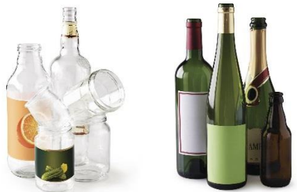
Bouteilles et bocaux en verre uniquement