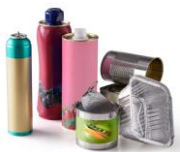
Emballages en métal et en aluminium