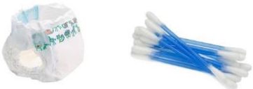
Couches et autres éléments hygiéniques