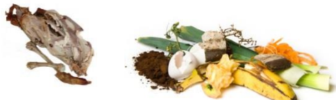
Restes de repas, viandes, poissons, fruits et légumes