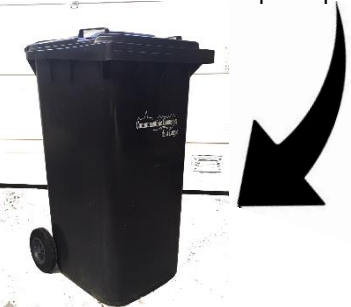
Petits objets en plastique