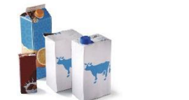
Briques et cartonnettes alimentaires