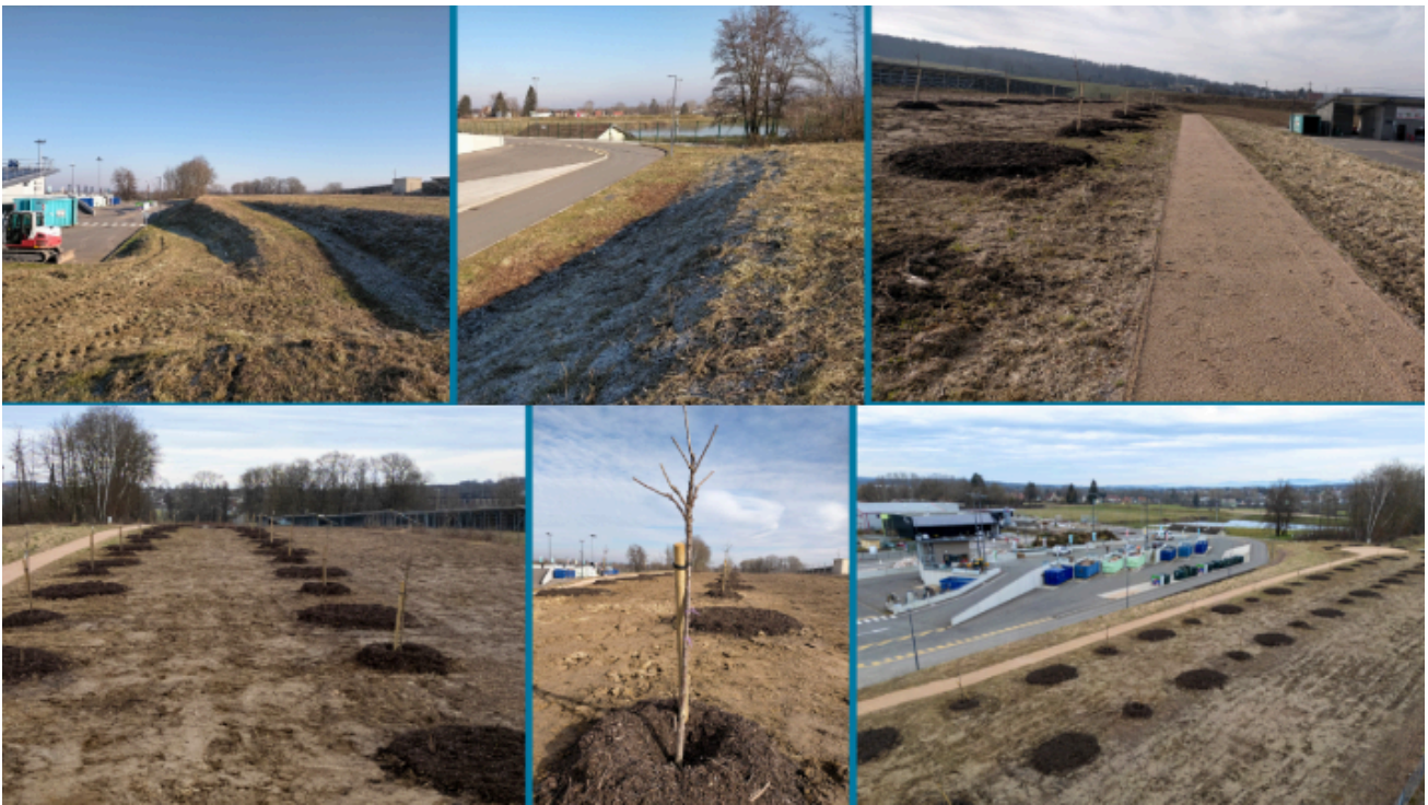
Avant - après : le sentier pédagogique prend forme sur le site du centre de tri ...

Ouvert en décembre 2022, le centre de valorisation de Retzwiller a pris en compte dès sa conception une réflexion sur l'aménagement de l'espace environnant intégrant la préservation de la biodiversité et le respect du cadre de vie des riverains. Il nous paraissait important de végétaliser les zones disponibles, notamment les abords des voies de circulation des véhicules et des espaces de dépôt de déchets. Il s'agissait aussi de garantir le bien-être des habitants et des usagers avec la création d'un environnement paysager de qualité. Cet aménagement s'inscrit également dans la continuité de l'espace pédagogique, ouvert au public et aux scolaires en 2023, qui vise à promouvoir l'éducation à l'environnement et l'écocitoyenneté. Les arbres viendront agrémenter un verger et le sentier pédagogique en cours d'aménagement à l'arrière du site. Il permettra aux visiteurs d'explorer la richesse des variétés locales et des panneaux explicatifs dédiés à la sensibilisation seront installés, favorisant la découverte de la faune et de la flore locale.