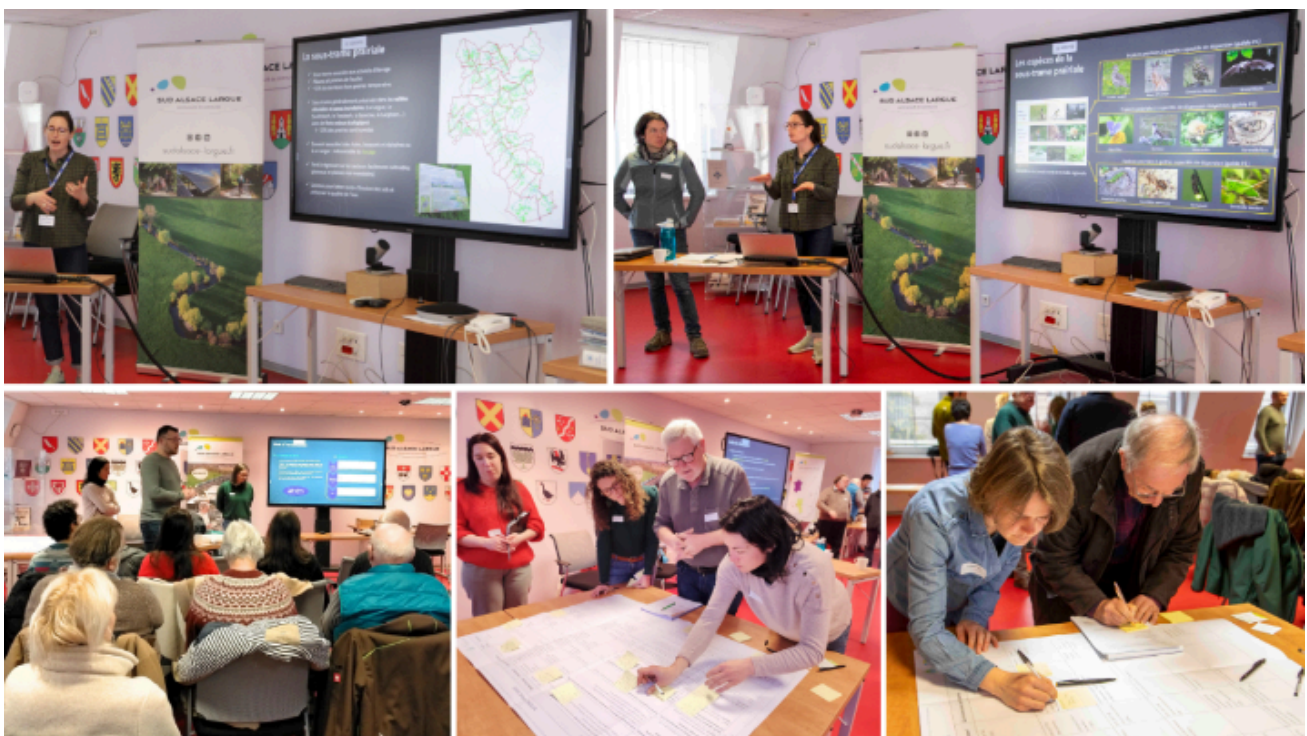
Un diagnostic de la biodiversité coconstruit avec les élus des communes, associations naturalistes, partenaires locaux et représentants des institutions .

Une démarche qui permet à la collectivité d'avoir une vision complète et transversale de la problématique écologique sur son territoire, ainsi que des solutions adaptées et construites par l'ensemble des parties prenantes.