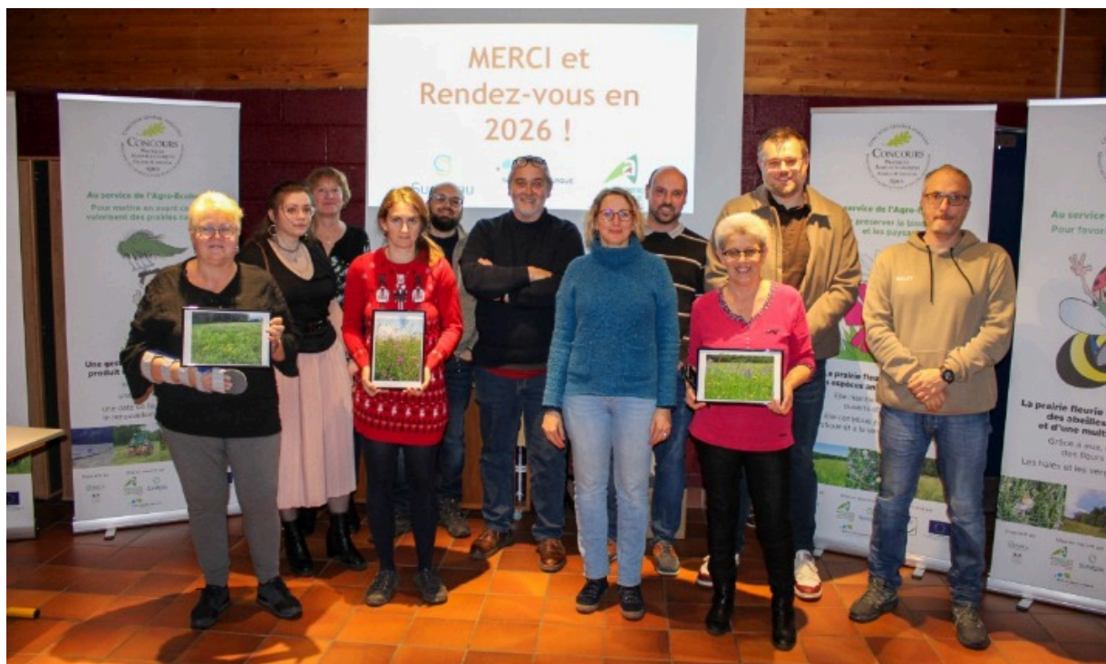
Nos trois lauréates du concours photo