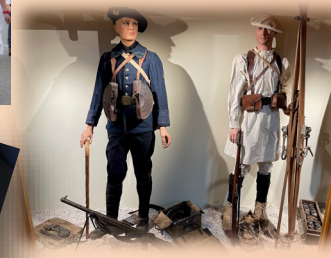
Chasseurs Alpin français