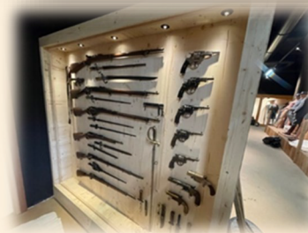
Armement allemand et français