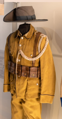
Uniforme allemand (Troupes coloniales)