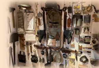
Paquetage d'un soldat allemand