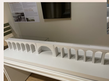
Modélisation du Viaduc de Dannemarie