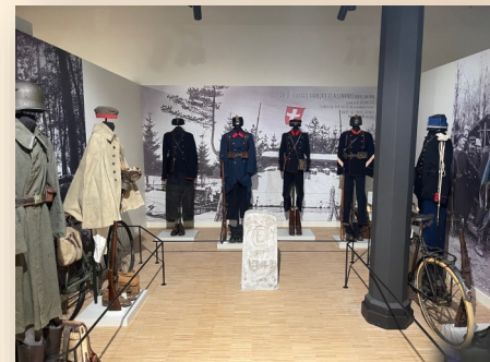
Zone des 3 frontières - Le Km0 et la barrière électrifiée