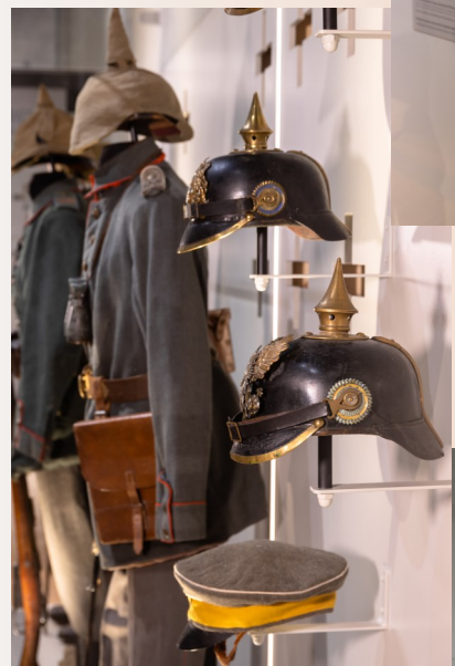
Casques et uniformes allemands