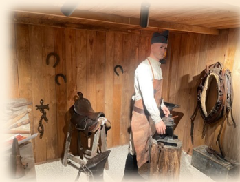
Le maréchal ferrant