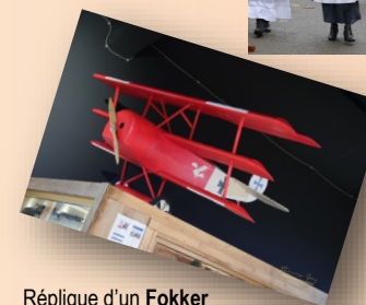
Réplique d'un Fokker Tri plan Baron rouge