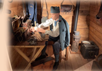
Un télégraphiste en action