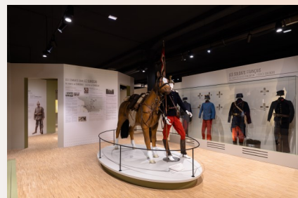
Dragon du 11ème régiment de Belfort