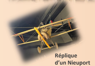
Réplique d'un Nieuport