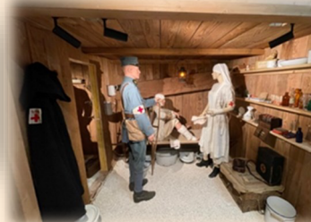
Infirmerie de guerre